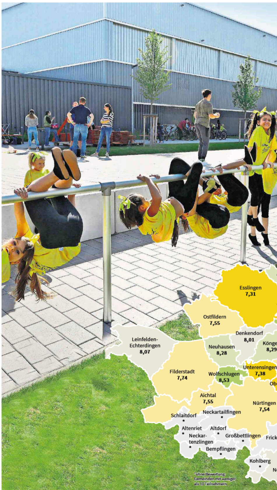
Der Esslinger Sportpark Weil hat die sportliche Infrastruktur erweitert.